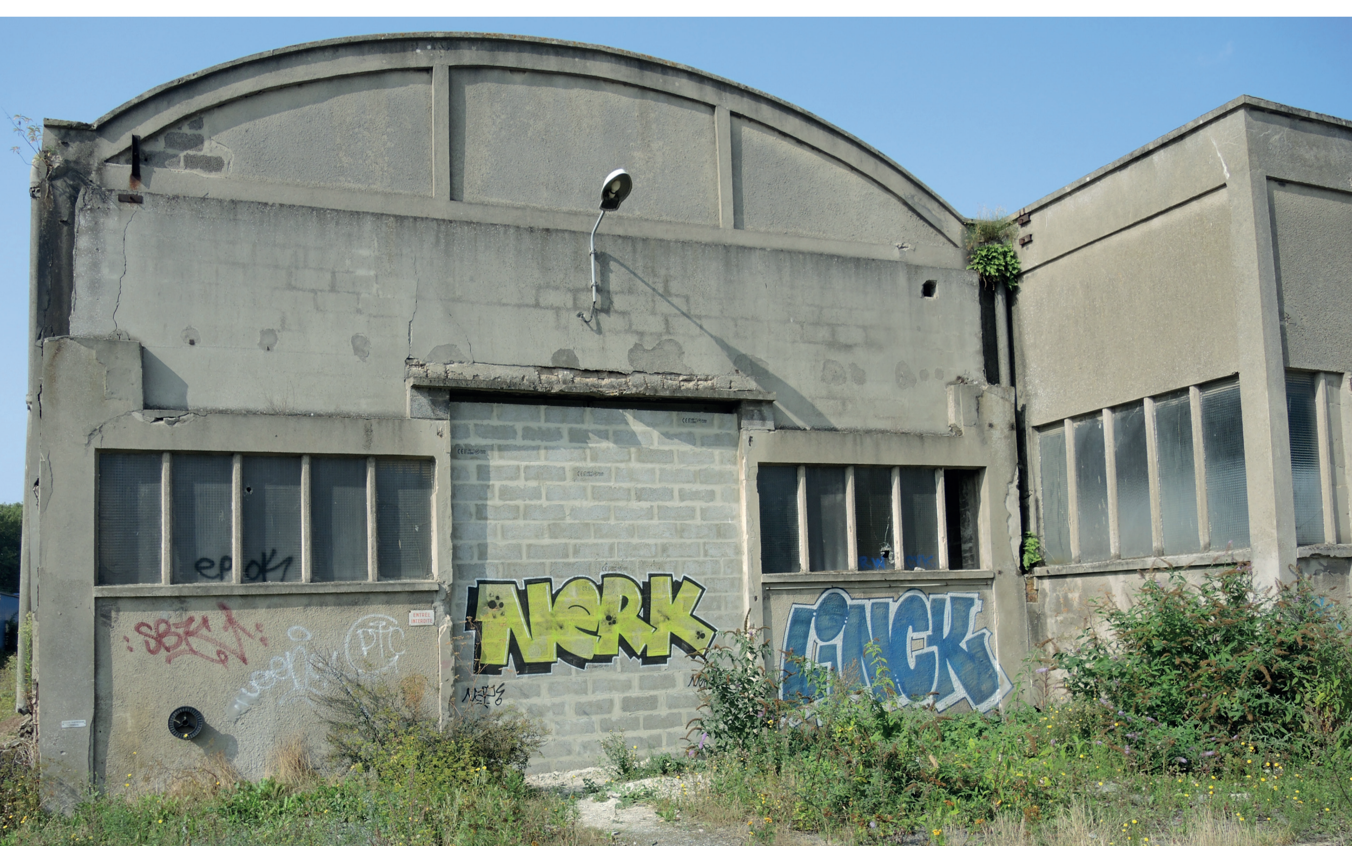
Priorité : sécuriser et préserver le bâtiment