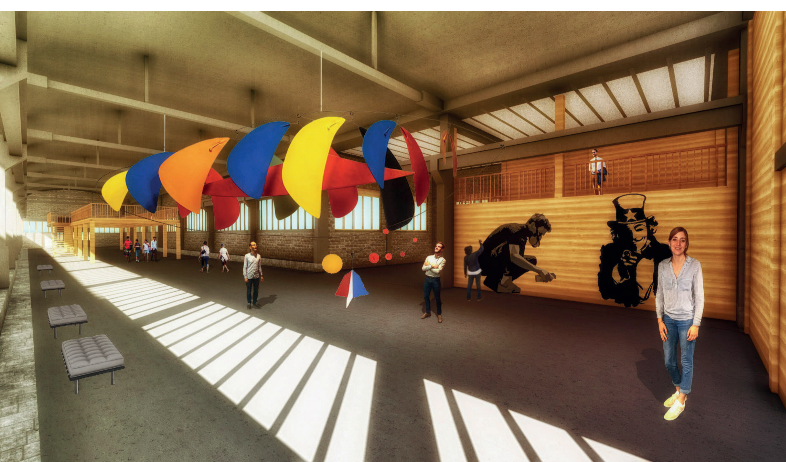
Un espace de création et d'exposition artistique